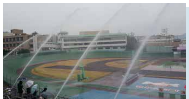
消防出初式で祝辞