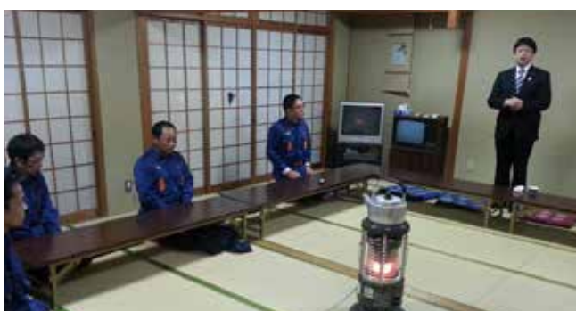
消防団年末警戒の激励