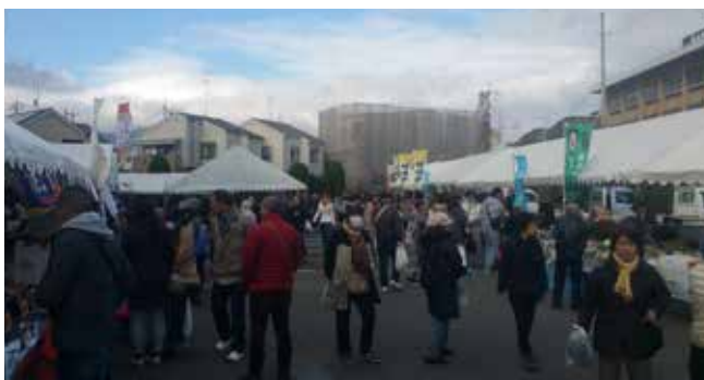
軽トラ市を開催 地元農業の活性化