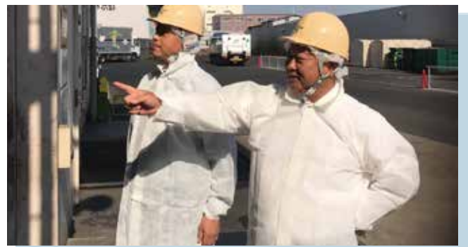
生ゴミを有機飼料化する工場見学