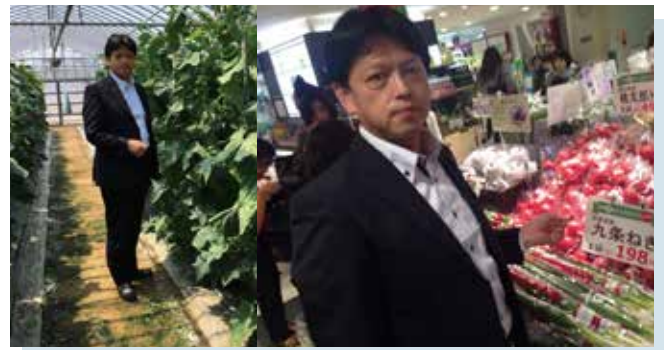
京都産の野菜をブランド化し、首都圏で販売