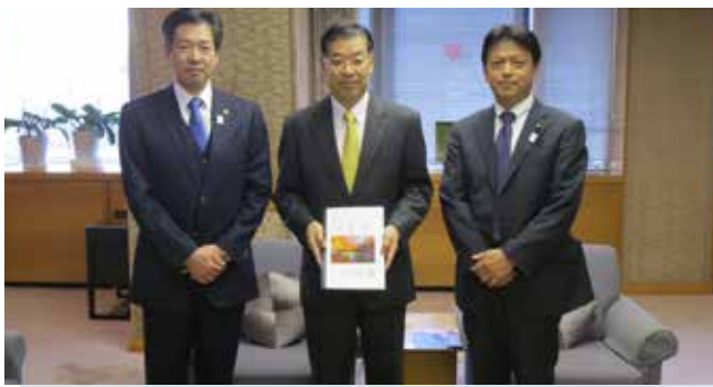
向日市の要望を京都府へ提出