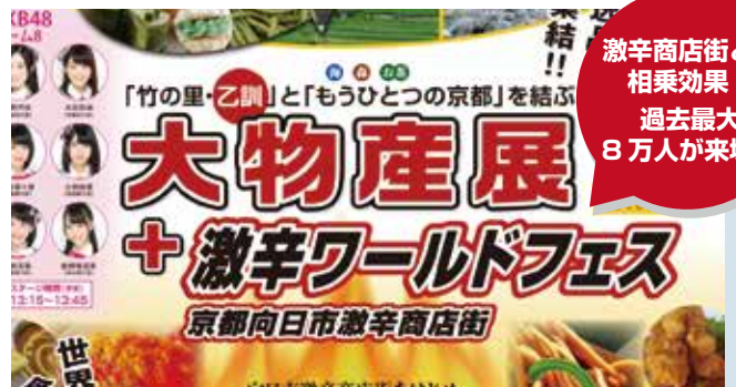
乙訓大物産展を激辛フェスと同時開催