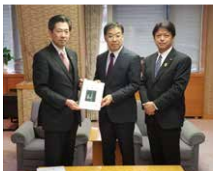
向日市の要望を京都府 山田知事へ 橋渡し