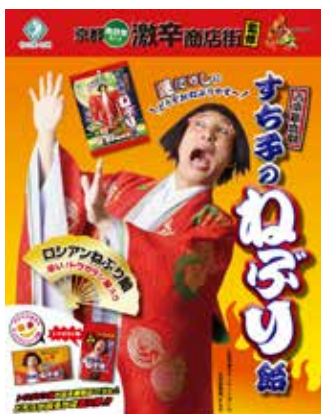
吉本新喜劇さんと 向日市激辛商店街 のコラボ商品 「すち子のねぶり飴」 が完成。 難波花月、祇園花月、 向日市内各地で販売