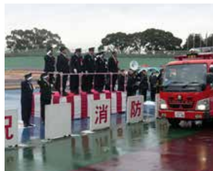
向日市消防出初式 安心・安全の確保を