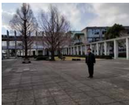
熊本大震災を教訓とした 防災教育システム視察