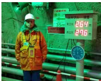
北海道 原子力研究 幌別深地層研究センター 地下530m視察