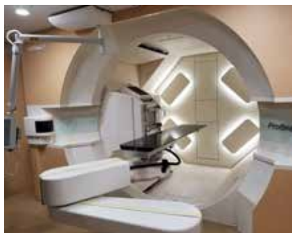
府立医大に永守記念最先端がん治療研究センター設置