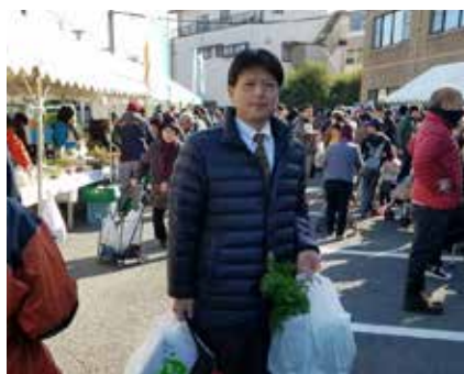
乙訓軽トラ市 農業の振興に