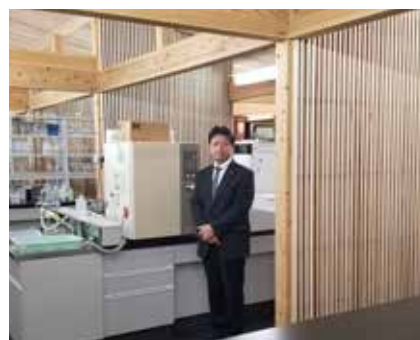
宇治市茶業研究所を視察 地域振興の研究