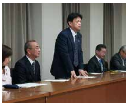
向日市の要望を国会、府会 市会議員と共有