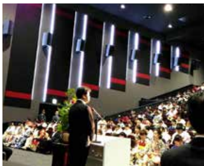
向日市成人式 若者に夢を持ってほしい